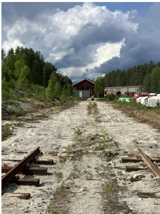
Tomten er ryddet og klargjort for bygging av et etterlengt vognmagasin.

Den såkalte banearbeidsuken (uke 30) ble i år viet klargjøring av byggetomten for vognmagasinet.