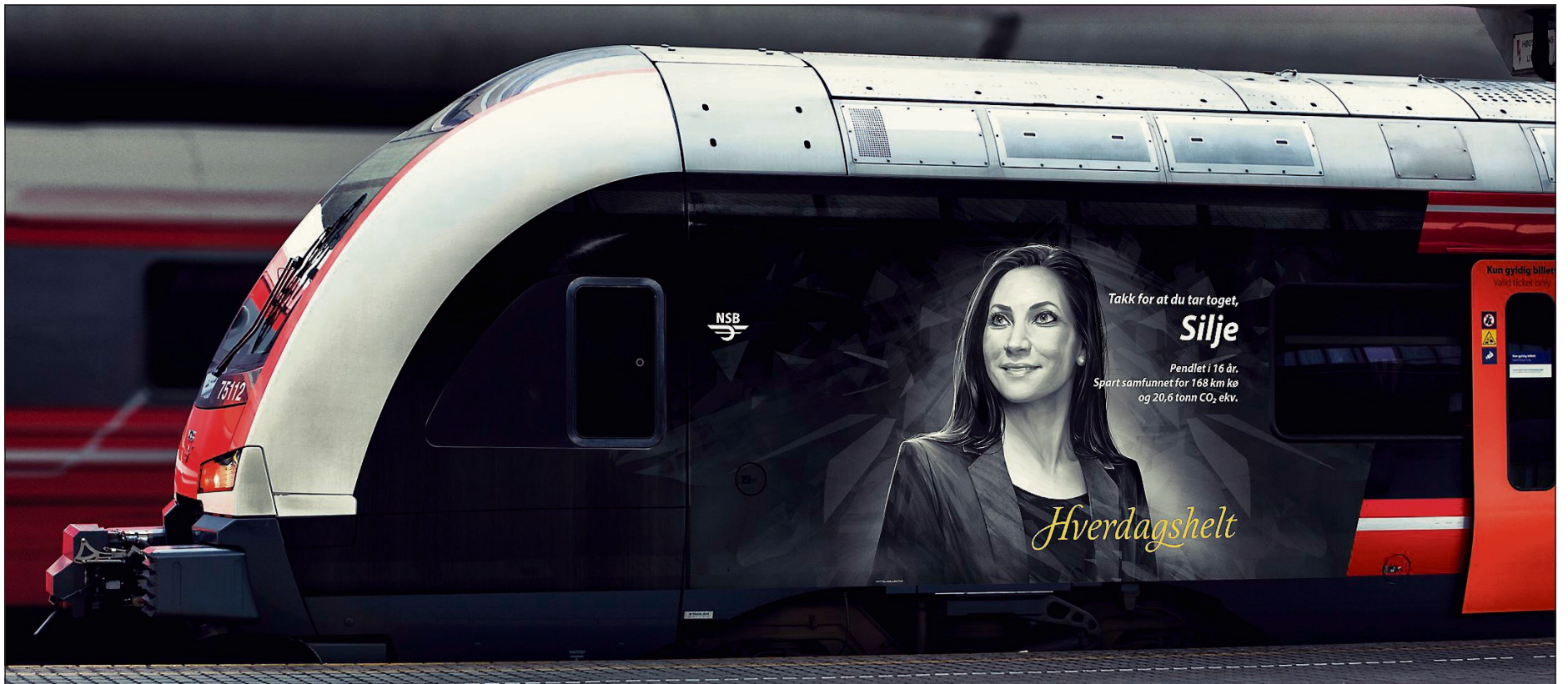
SILJE I 200: Slik vil togsettet med Silje fra Jessheim bli seende ut når det blir foliert. Deretter skal hun suse i inntil 200 km/t på utsiden av toget rundt om på Østlandet. Det synes det administrative lederen hos Legal 24 Advokat bare blir stas. ILL.: NSB

■ Har spart samfunnet for 160 kilometer med bilkø